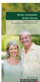
OCT unklare Sehstörung