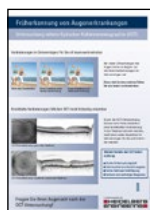
Poster „Früherkennung mit dem OCT“