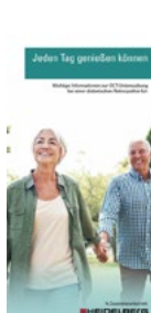
OCT diabet. Retinopathie